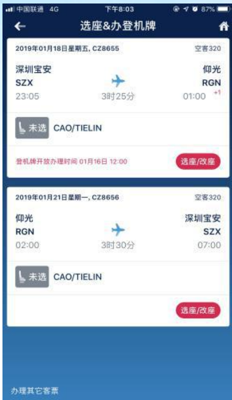
选择需要选座的航班