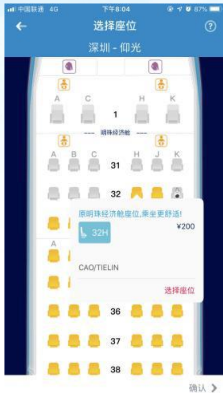
不同座位付费价格不同